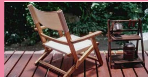
オープンテラス& ウッドデッキ