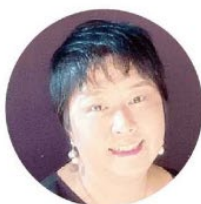
監修/中川由紀子 一級建築士

私自身が育児、家事と仕事を両立させるために悩んだ経験をすべて活かして、同じように悩む、子育て中のパパ・ママたちが「子育て中だから、家づくりが楽しい！」そう思ってもらえるように「LIFE STYLE子育ての家」のプランニングをさせていただきました。