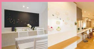
ひらめきキャンパス