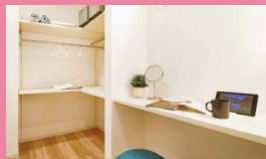
ランドリールーム

より快適な子育てライフを実現にする為に、必要な設備をカスタマイズできます。テレワークスペースや家事で役立つランドリースペースはもちろんのこと、自由に描いたり、家族の掲示板として活用できるひらめきキャンパスなどお子様もうれしい設備のオプションもございます。